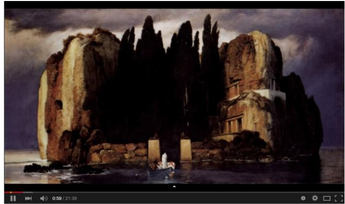
Sergei Rachmaninov - The Isle Of The Dead